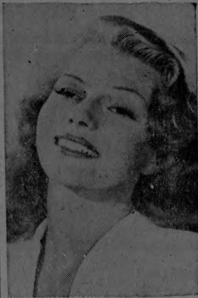
La tez de mujeres tan encantadoras como la preciosa RITA HAYWORTH, estrella de la Columbia, es siempre complementada con tonos apropiados de polvo facial, afirma el experto de Hollywood Max Factor Jr.

primeros síntomas de acné, consulte con su médico y él podrá decirle si la presión que hace sobre la piel al aplicarse el polvo puede o no irritarle más los poros. Si vé que la irritación que tiene usted es muy ligera, probablemente le aconsejará que use la mota sólo una vez, para evitar que la infección se extienda más. Y si la infección está en un grado avanzado, es muy posible que le prohíba usar la mota en absoluto, hasta que se haya curado.