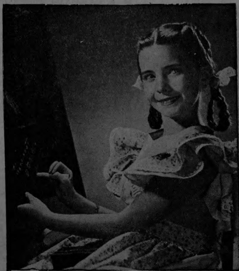
MARGARET O'BRIEN... ESTRELLITA DE LA METRO GOLDWYN MAYER.

La adaptabilidad y el don de provocar fuertes emociones son las dos cualidades que con mayor frecuencia citan los críticos al referirse a Margaret O'Brien.